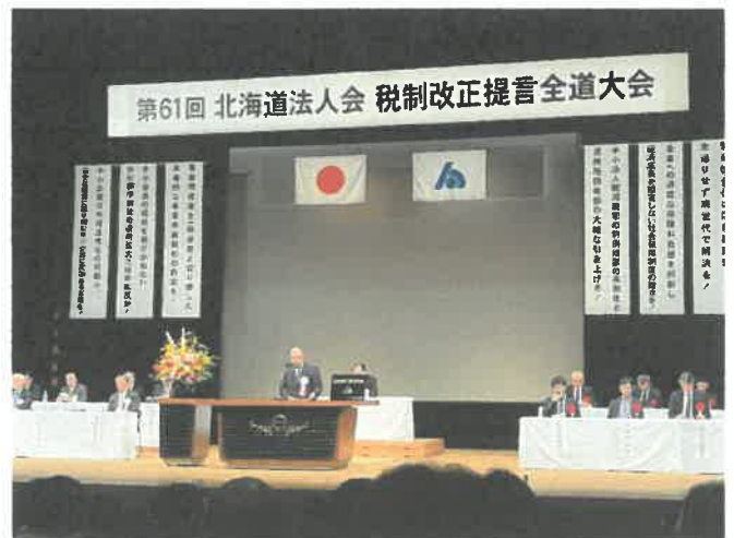
大会会場 (苫小牧市民会館大ホール)