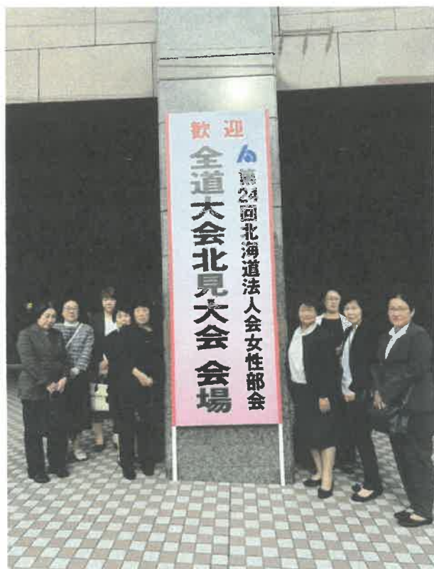
大会会場（ホテルベルクラシック北見）前にて