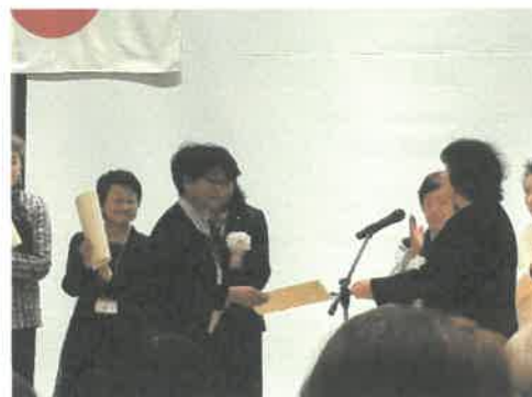
税に関する絵はがきコンクール「優秀賞」受賞