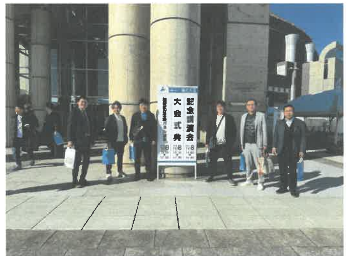
大会会場 (サンドーム福井) にて