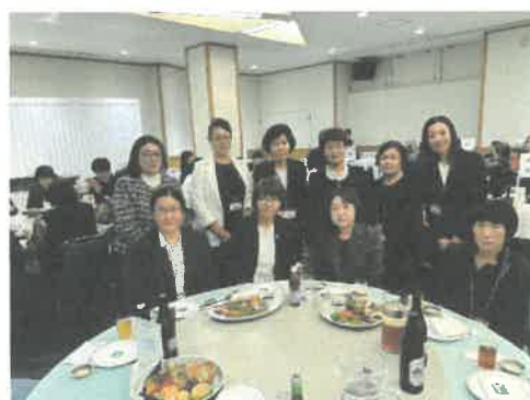
懇談会会場（ホテル黒部）にて